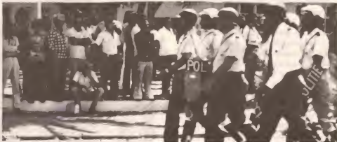
Pa demostra nan forza y pa crea miedo den e pueblo Arubano, un batalion di Riot Commando manda for di Corsow door di e ministro di justicia, Sr. Leo Chance, ta marcha dilanti di Bestuurskantoor ariba un di e dianan di tension na Augustus.

Ariba orden di tanto e hefe di local di polis y ministro di justicia, un avion yen yen di riot comandonan a worde manda Aruba kendenan a yega pa exactamente 2'or di marduga.